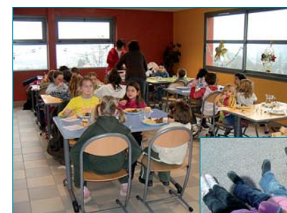
Accueil périscolaire dans la nouvelle école intercommunale de Tournon

Délégué Commission Jeunesse et Action Sociale