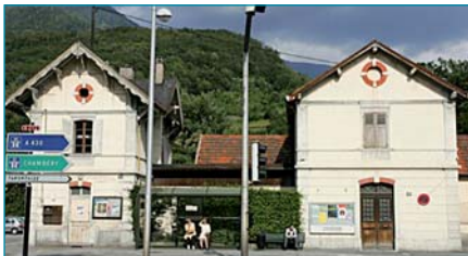
Les futurs locaux de la Maison de Pays, situés en face de l'Hôtel de Ville d'Albertville

Le développement touristique est important : il permet de favoriser le développement de l'habitat et l'activité économique. C'est dans ce sens que les délégués communautaires de la Haute Combe de Savoie ont confirmé à plusieurs reprises leur participation au projet Maison de Pays.